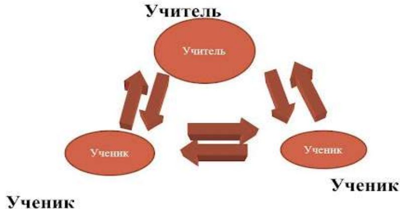
Схема взаимосвязи: ученик - учитель

С первых дней пребывания иностранного слушателя в России нужно строго контролировать его учебу и поведение. Выбрать старосту в группе, который станет помощником куратора. Воспитывать, методически правильно строить взаимоотношения «учитель-ученик» по всем правилам педагогики. Строго относиться к пропускам и невыполнениям домашнего задания. Показывать пример этики и культурного поведения.