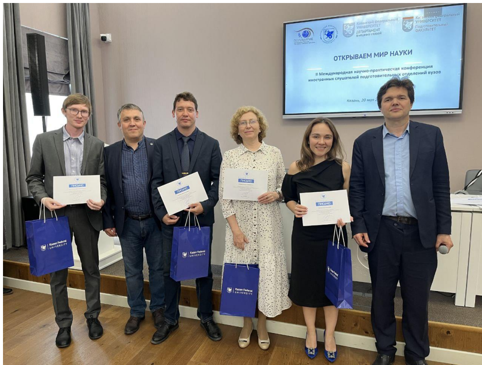
Совет экспертов конференции