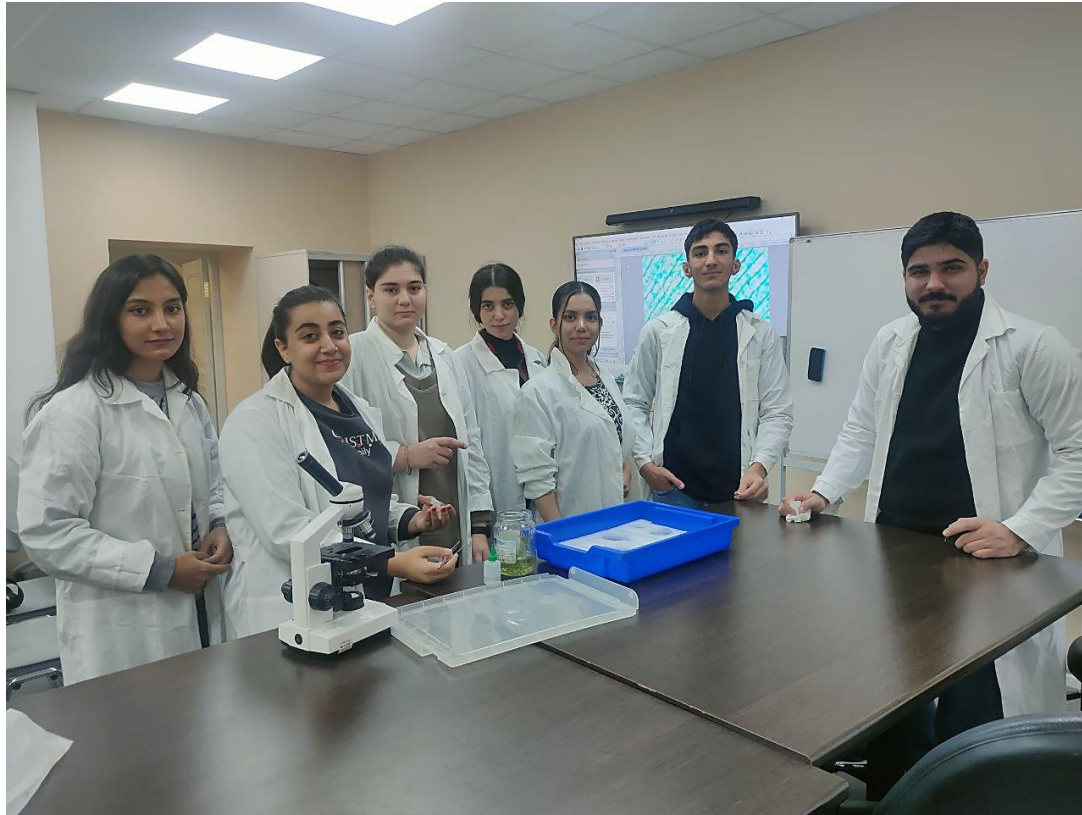
Лабораторная работа по биологии