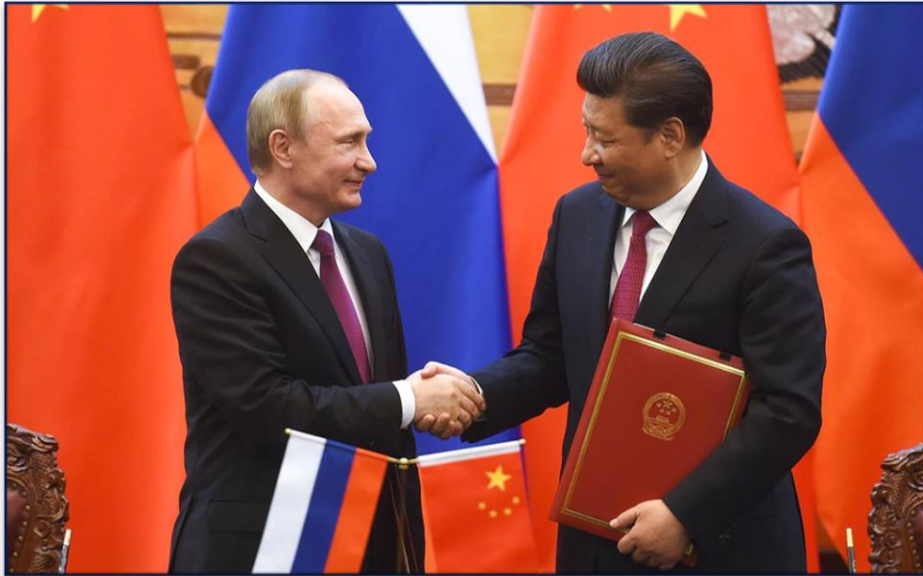
В.В. Путин и председатель КНР Си Цзиньпин

Укрепление российско-китайских отношений способствует ежегодному увеличению студенческих обменов между двумя странами, а также популяризации китайского языка в России и русского языка в Китае.